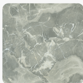
Površinska tekstura Office