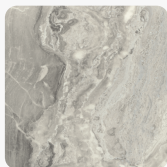
Površinska tekstura Office