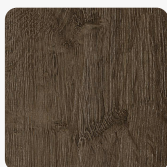
Površinska tekstura Paragon