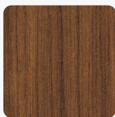
Warmia orah smeđi H1307 ST19 Površinska tekstura Deepskin Excellent